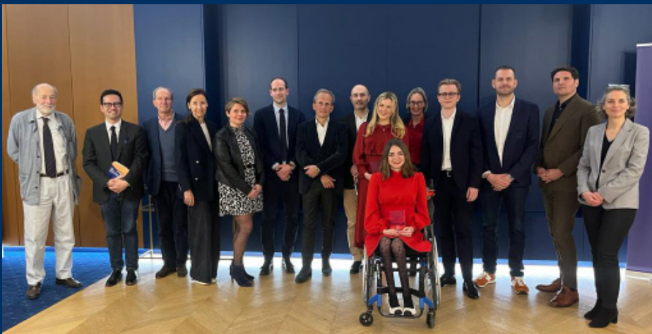
Cérémonie de remise des prix étudiants, édition 2022