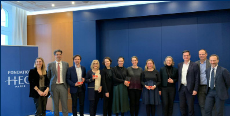
Cérémonie de remise des prix professeurs, édition 2022