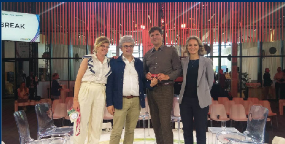
Remise du prix Impact lors du Sommet ChangeNOW en 2023